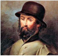
Lope de Rueda