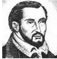
Fernando de Rojas